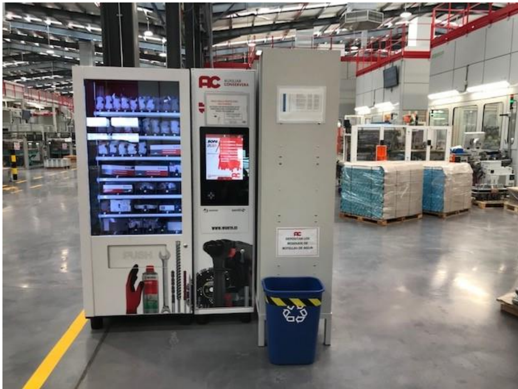
Máquina expendedora nave PR2 Centro Torrealta

Coexistimos con riesgos presentes en nuestros procesos por lo que debemos hacer uso de los equipos de protección individual.